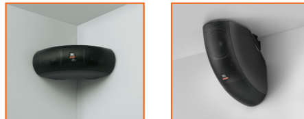
Optie 4: Als horizontale opstelling met drie speakers , bevestigd aan de muur in een hoek (met bijgeleverde muursteen)