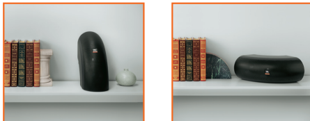
Optie 3: Op een muur , verticaal, horizontaal of in een opstelling met twee speakers (met bijgeleverde muursteen)